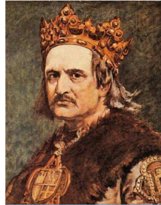
Władysław Jagiełło Król Polski 1386 – 1434.

Po śmierci Władysława Jagiełły, królem Polski został jego syn Władysław (nazwany później Warneńczykiem) , gdy zaś umarł Warneńczyk na polskim tronie zasiadł młodszy syn Jagiełły – Kazimierz Jagiellończyk .