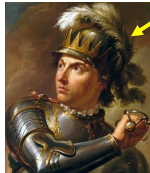
Władysław Warneńczyk Król Polski 1434 – 1444.

Wyjaśnienie: z ostatnich lekcji powinniście pamiętać, że żona Jagiełły czyli Jadwiga bardzo młodo zmarła. Synowie Władysława Jagiełły pochodzili z jego drugiego małżeństwa z Zofią Holszańską.