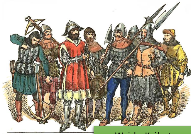
Wojsko Królestwa Polskiego.