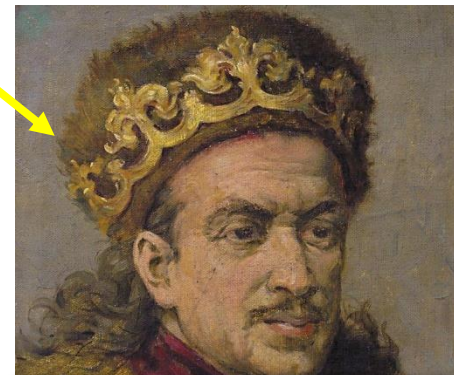
Kazimierz Jagiellończyk Król Polski 1447 – 1492.